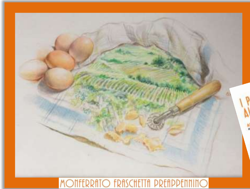
MONFERRATO FRASCHETTA PREAPPENNINO