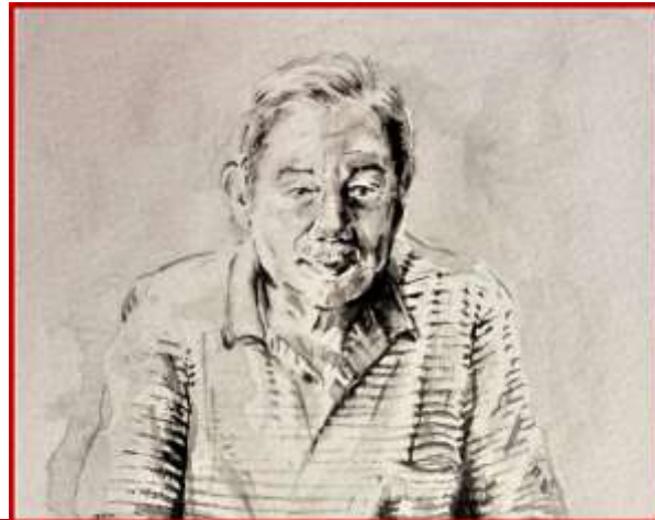
CECILIA PRETE, Ritratto di LUIGI BRUNI (acquerello su carta, dettaglio - 2017)